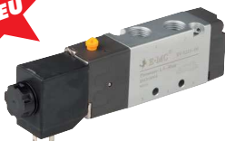
5/2 Wege (Federrückstellung)