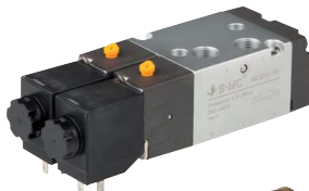
5/2 Wege (Impulsventil)