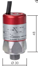
Typ DRSW ... X

Werkstoffe: Typ DRSW: Körper: Stahl verzinkt, Aluminium eloxiert, Typ DRS: Körper: Aluminium, Membrane*: NBR Temperaturbereich: -20°C bis max. +80°C Rückschaltdifferenz: Typ DRSW: >10 bis 20%, Typ DRS: 10 bis 30% Schutzart: IP 65 Elektrischer Anschluss: 2 m Kabel (3-adrig) Schaltertyp: Wechsler