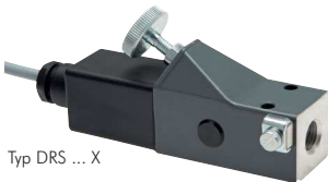
Typ DRS ... X