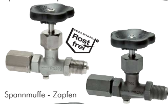
Spannmuffe - Zapfen