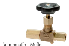
Spannmuffe - Muffe