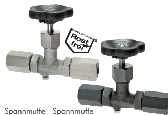
Spannmuffe - Spannmuffe