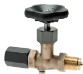
Spannmuffe - Zapfen