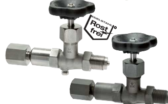
Drehbare Muffe - Zapfen mit Schaft für Messgerätehalter