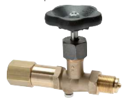
Drehbare Muffe - Zapfen mit Schaft für Messgerätehalter