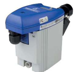
Typ BEKOMAT 31 U

* bezogen auf 1 bar abs. und 20°C, ** wird ohne potentialfreien Kontakt geliefert, *** Höhe des niedrigsten seitlichen Zulaufs in Klammern