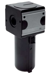
Typ FA 12 MBK