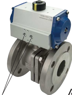
für Namuranschluss und IG

Optional: FKМ-Dichtung (-20°C bis max. +120°C) -V