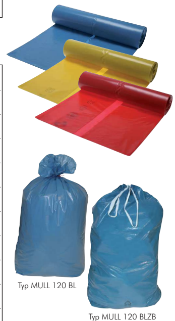
Typ MULL 120 BL