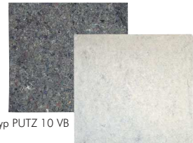
Typ PUTZ 10 VB