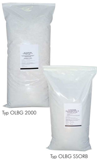
Typ OLBG 2000