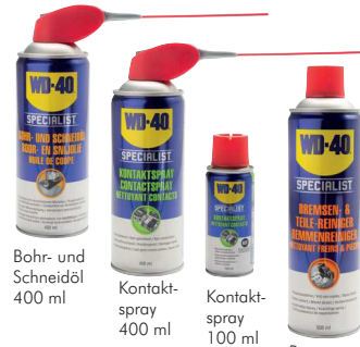
Bohr- und Schneidöl 400 ml