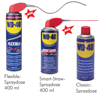
Flexible-Spraydose 400 ml