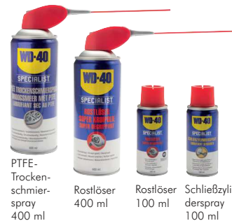
PTFE-Trockenschmierspray 400 ml