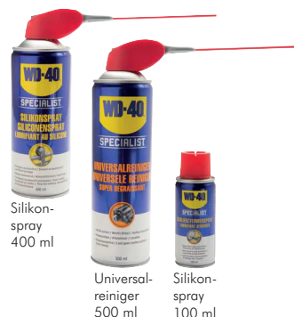
Silikonspray 400 ml