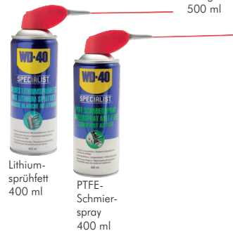
Lithiumsprühfett 400 ml