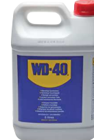
Kanister 5 Liter